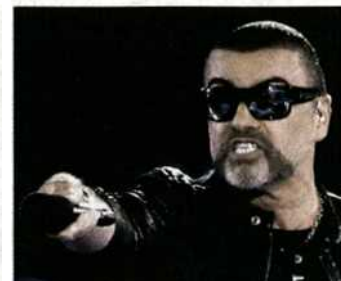
Fit und gut drauf: George Michael probt bis Ende der Woche in London